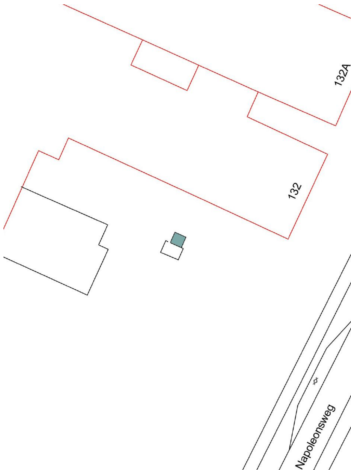
Kaart met bescherming