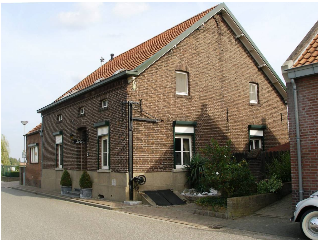
Hanssum 42 met de hijsinstallatie tegen de zijgevel en het kelderluik toegang tot de voorraad kelders