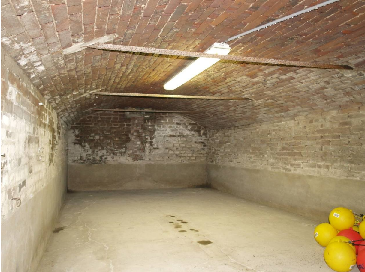
De oostelijke kelderruimte van Hanssum 40b