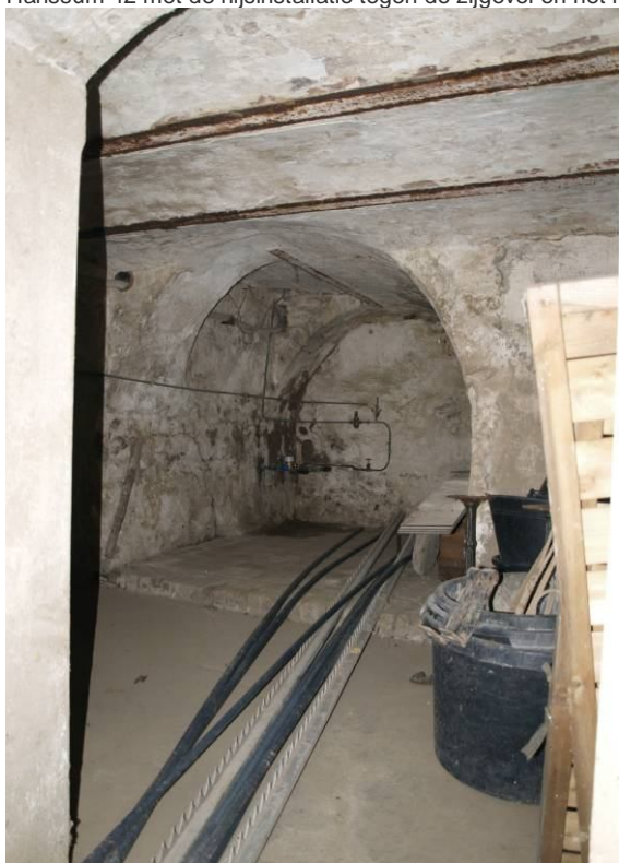
Kelder Hanssum 42