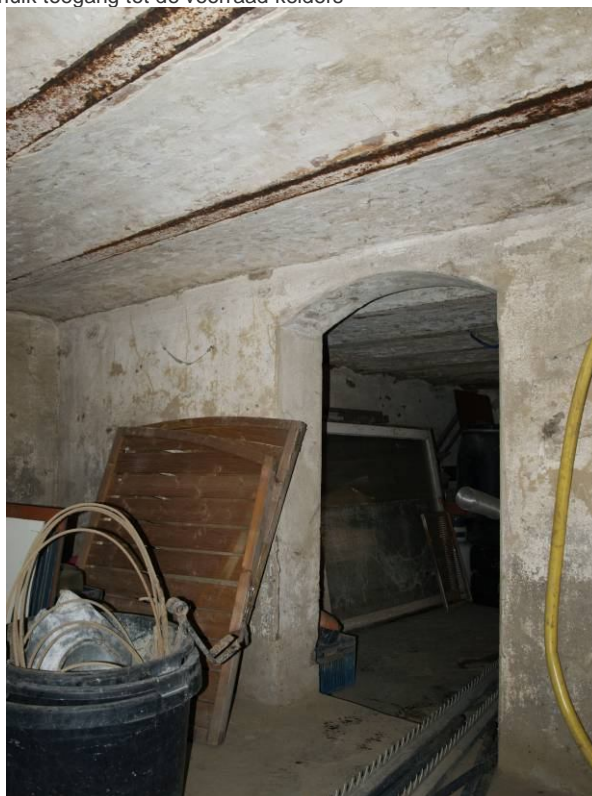
Kelder Hanssum 42