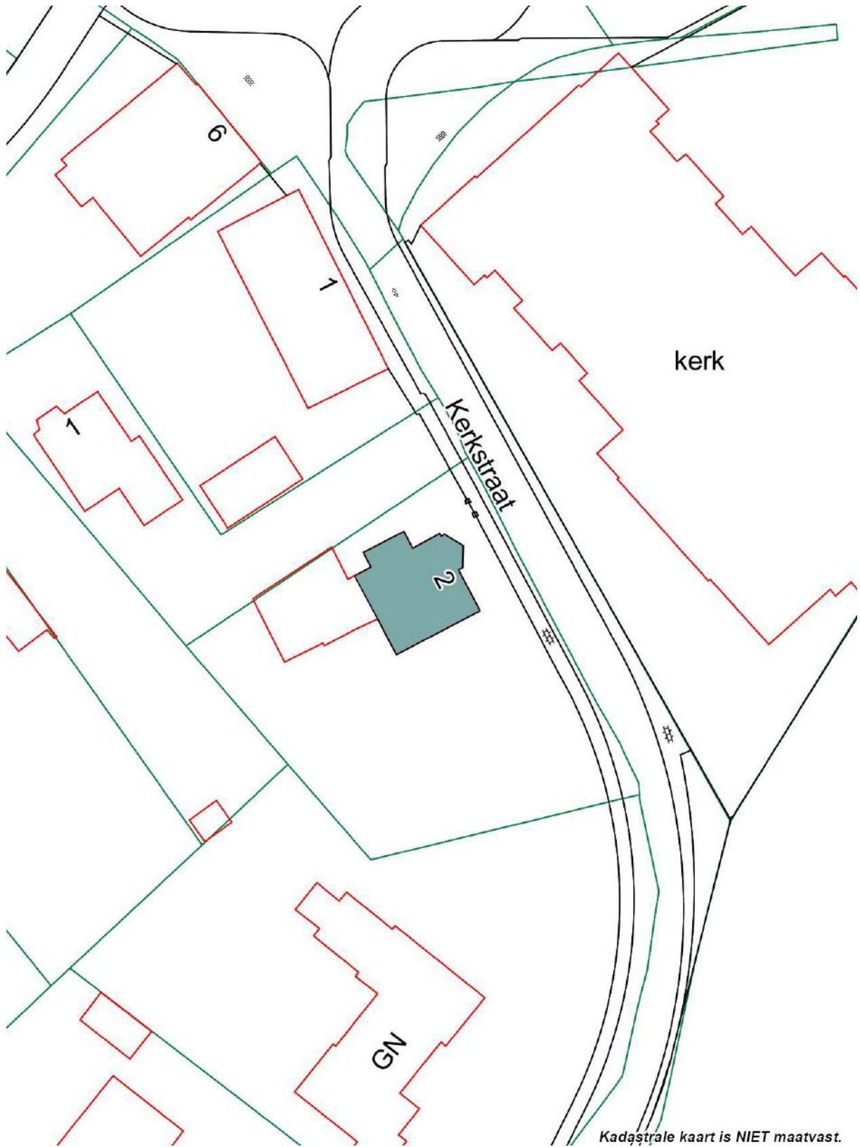
Kaart met bescherming