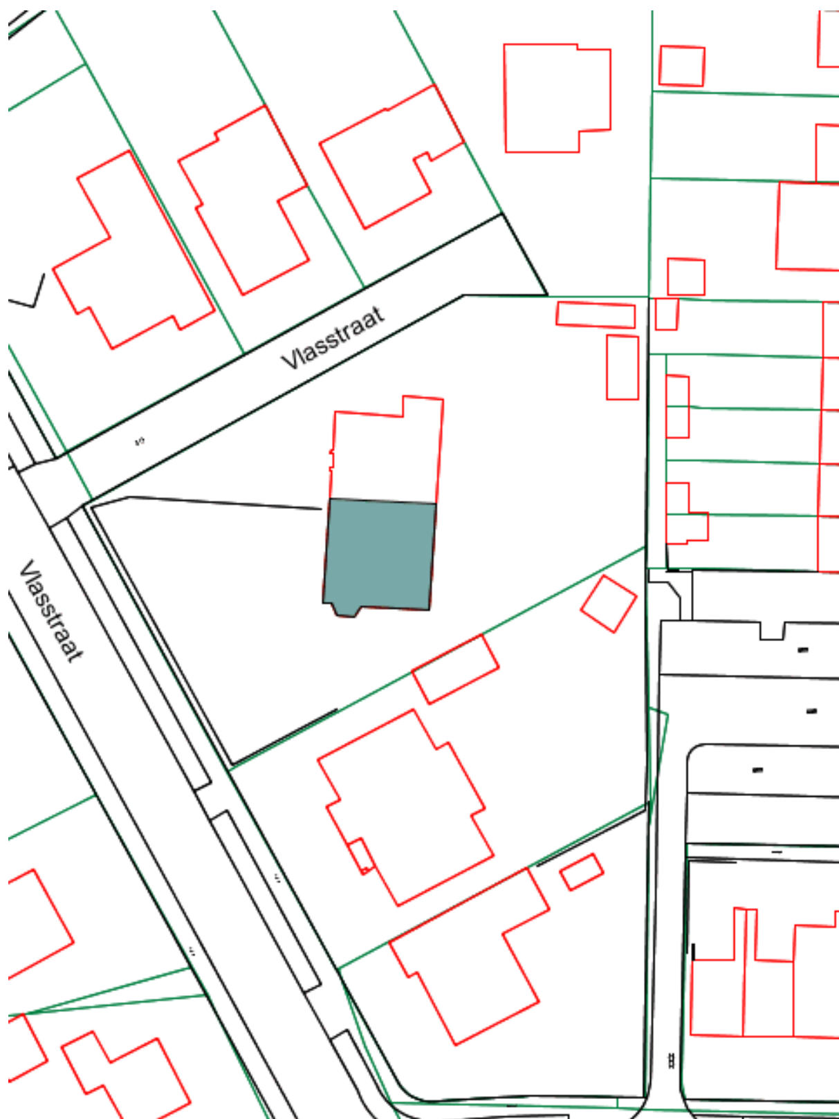
Kaart met bescherming