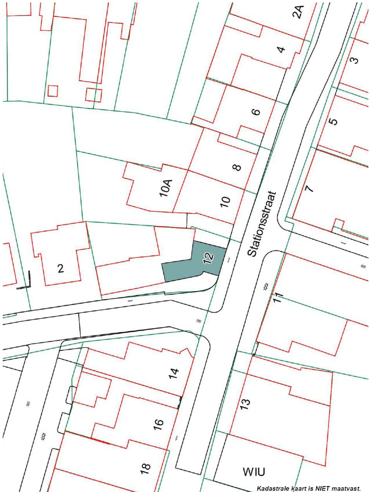
Kaart met bescherming