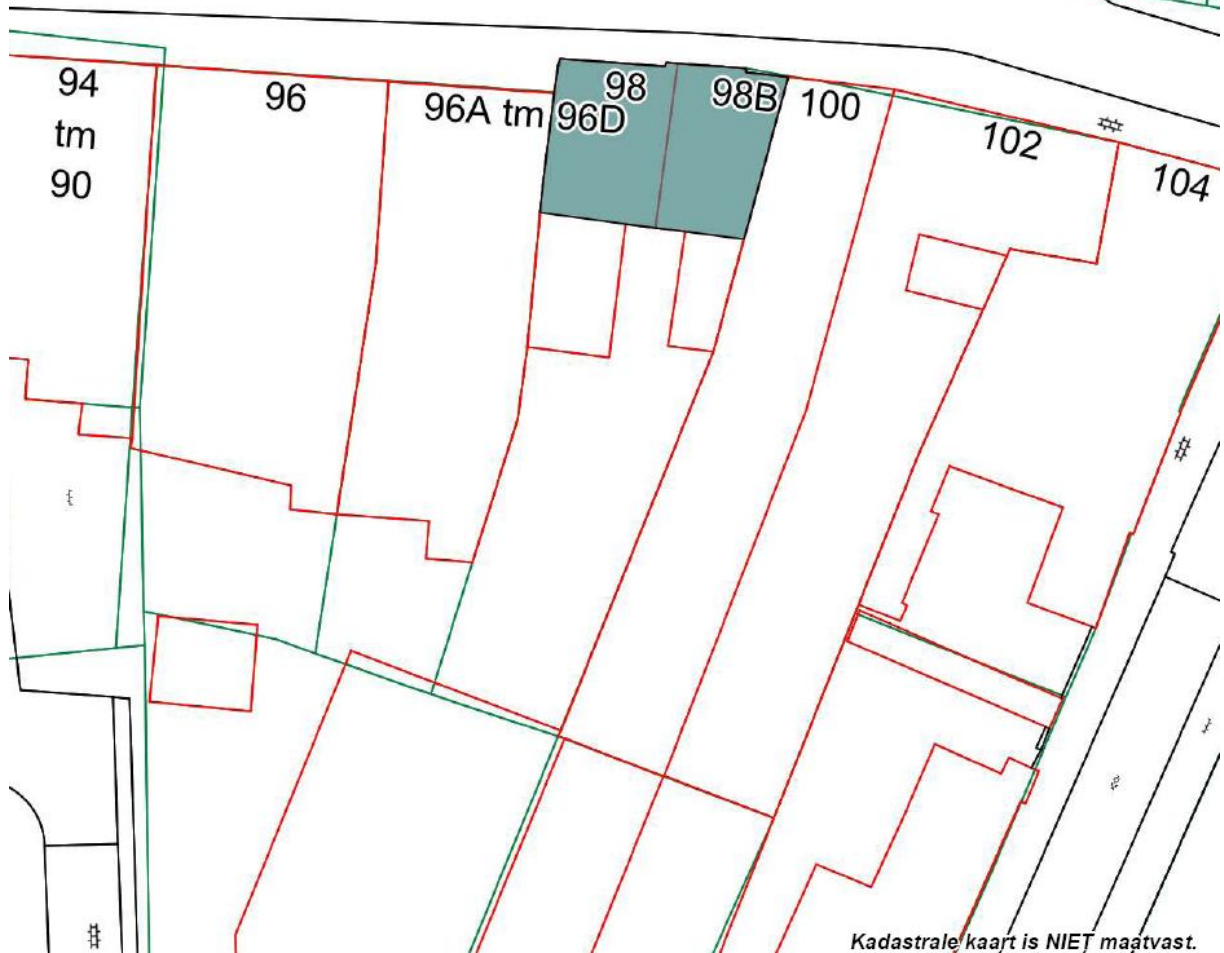
Kaart met bescherming