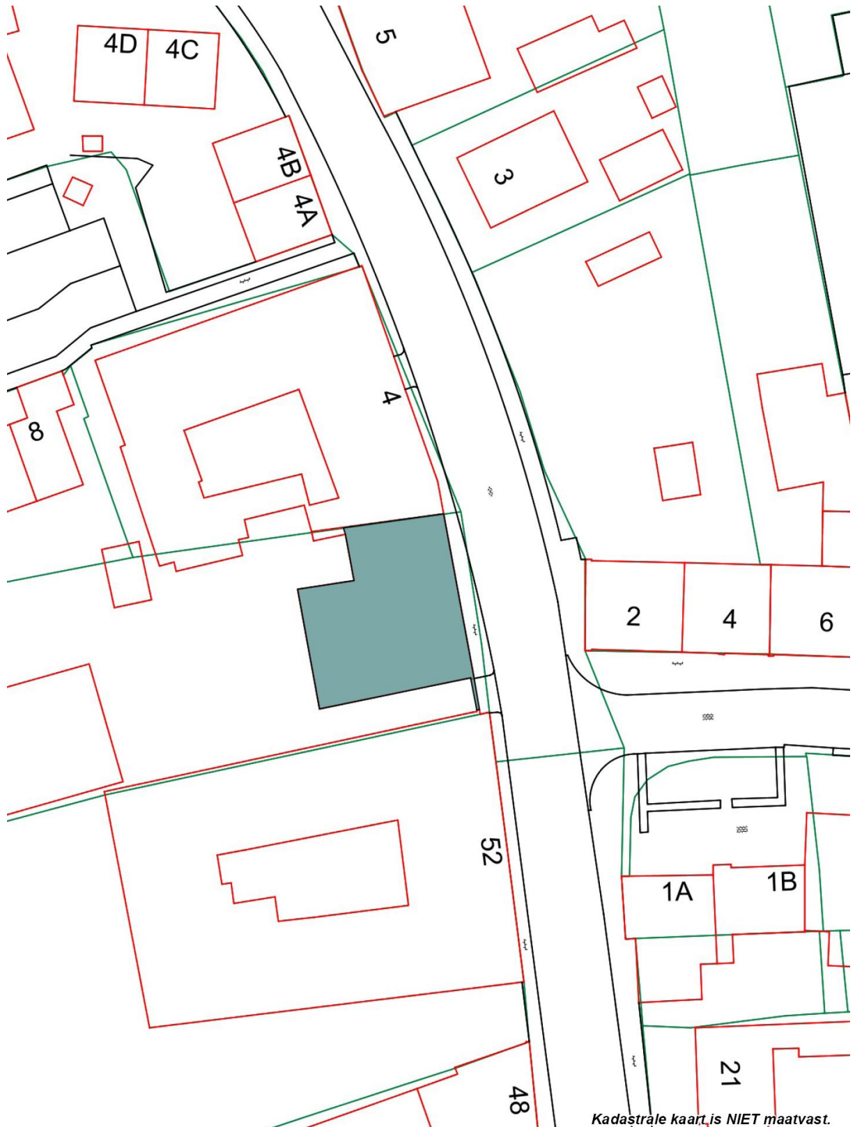
Kaart met bescherming