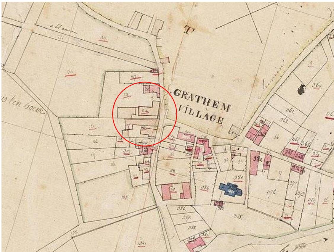
Kadastrale Minuutplan 1832 met daarop de ligging van het pand Lindenstraat 2