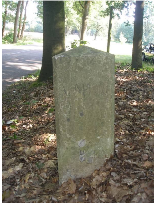
Grenssteen aan de Roggelseweg te Haelen