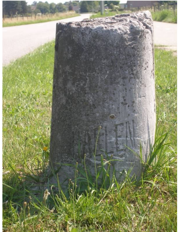
Grenssteen aan de Haelenerweg te Buggenum